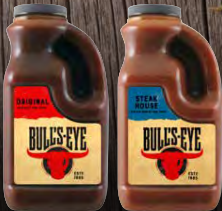
Bull's Eye Original BBQ Sauce Varenr. 1001148 Kolti: 3 x 2 L Bull's Eye Steakhouse Sauce Varenr. 993864 Kolti: 3 x 2 L

Bull's-Eye er udviklet af og til folk med en ægte lidenskab for kød. Spidsbryst, vinger, ribben eller ribeye? Bull's-Eye leverer smag til det hele.