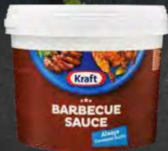
Kraft BBQ Sauce Professional Varenr. 993904 Kolti: 1 x 5 kg

1 kg HP, 1 kg ketchup & 15 dråber Carolina Reaper = Ny spicy dyppeelse