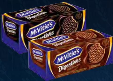
McVities Digestive Dark Varenr. 993432 Kolli: 12 x 300 g McVities Digestive Milk Varenr. 993373 Kolli: 12 x 300 g