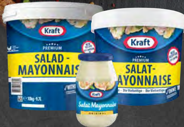
Kraft Salat Mayonnaise Varenr. 992747 Kolti: 12 x 480 ml Kraft Salat Mayo Varenr. 990823 Kolti: 1 x 5 kg Kraft Salat Mayo Varenr. 990824 Kolti: 1 x 10 kg