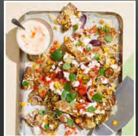
WASA – DE SPRØDESTE NACHOS