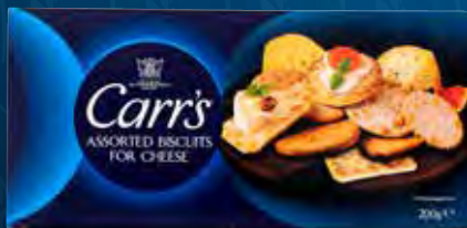
Carr's Bisc For Cheese Varenr. 993453 Kolli: 6 x 200 g