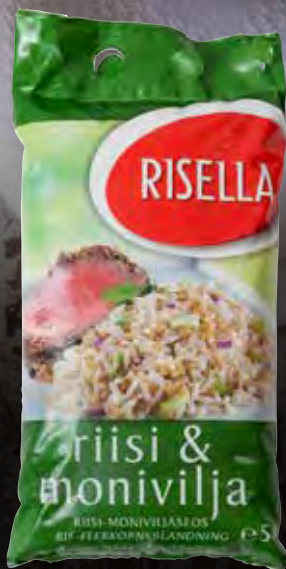
Risella – Wholegrain Rice Varenr. 973246 Kolti: 5 kg