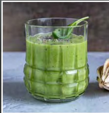
HERMESETAS – SUND SMOOTHIE