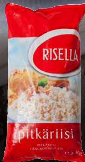
Risella – Long Grain Rice Varenr. 973249 Kolti: 2 x 5 kg