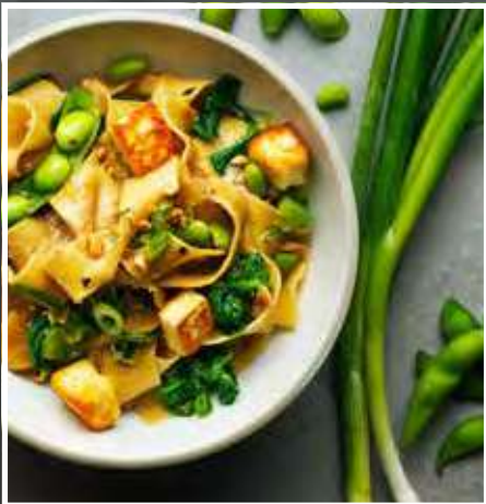
BARILLA – PASTA TIL KØLIGE DAGE