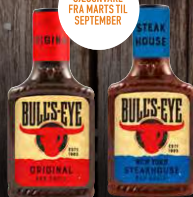
Bull's Eye Original BBQ Sauce Varenr. 992830 Kolti: 6 x 300 ml Bull's Eye New York Steakhouse BBQ Sauce Varenr. 992831 Kolti: 6 x 300 ml