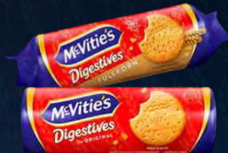
McVities Digestive Fuldkorn Varenr. 993374 Kolli: 21 x 400 g McVities Digestive Original Varenr. 993372 Kolli: 21 x 400 g