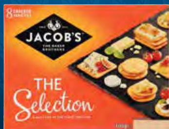
Jacob's Biscuits for Cheese Varenr. 1000827 Kolli: 10 x 300 g